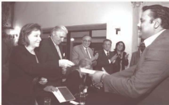
Entrega de la segunda parte del Estímulo Antonio Ariza Cañadilla, abril 2007.