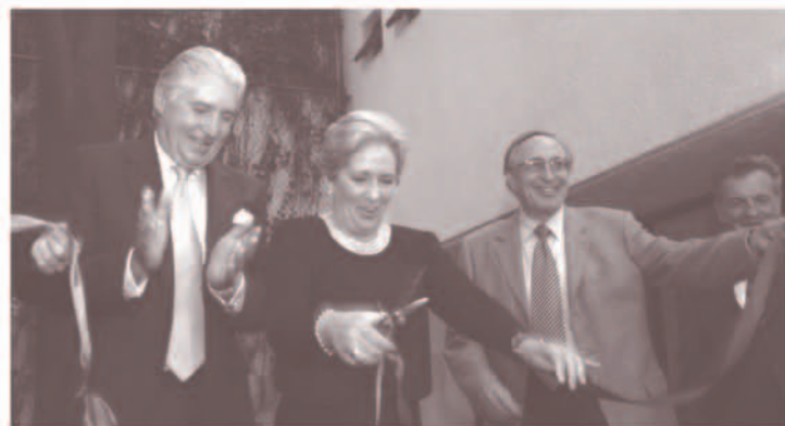
Inauguración de la nueva sede de FundHepa, 17 de abril 2007.

En 1998 surgió la idea de crear la Fundación Mexicana para las Enfermedades Hepáticas con el fin de revertir el avance de las enfermedades del hígado en México. Se han dado los pasos necesarios para llevar a cabo la organización e institucionalización. Hoy la Fundación Mexicana para la salud Hepática, FundHepa es una realidad que ha impactado ya en múltiples foros y ha beneficiado a un gran número de personas, pero falta mucho por hacer.